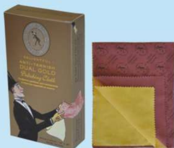
Салфетка двойная для полировки и очистки изделий из золота TOWN TALK