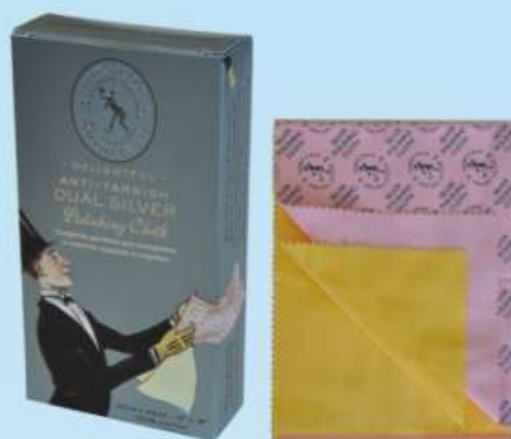
Салфетка двойная для полировки и очистки изделий из серебра TOWN TALK