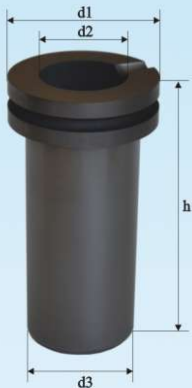
Тигель графитовый G.GM.1000SH 1 кг стакан большой

размеры : d 1 - 65 мм d 2 - 38 мм d 3 - 50 мм h - 125 мм